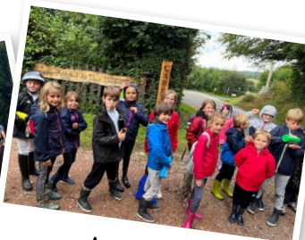
le petit cob