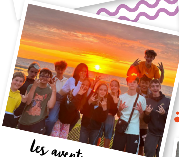
les aventuriers de la glisse