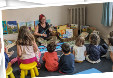
Partir en livre