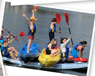
Défis Sports Nature