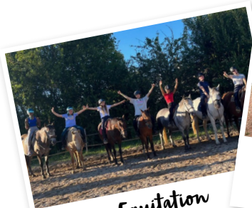
Equitation bord de mer